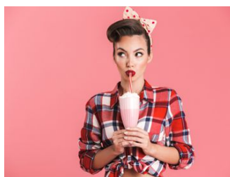
MARCHÉS À THÈME